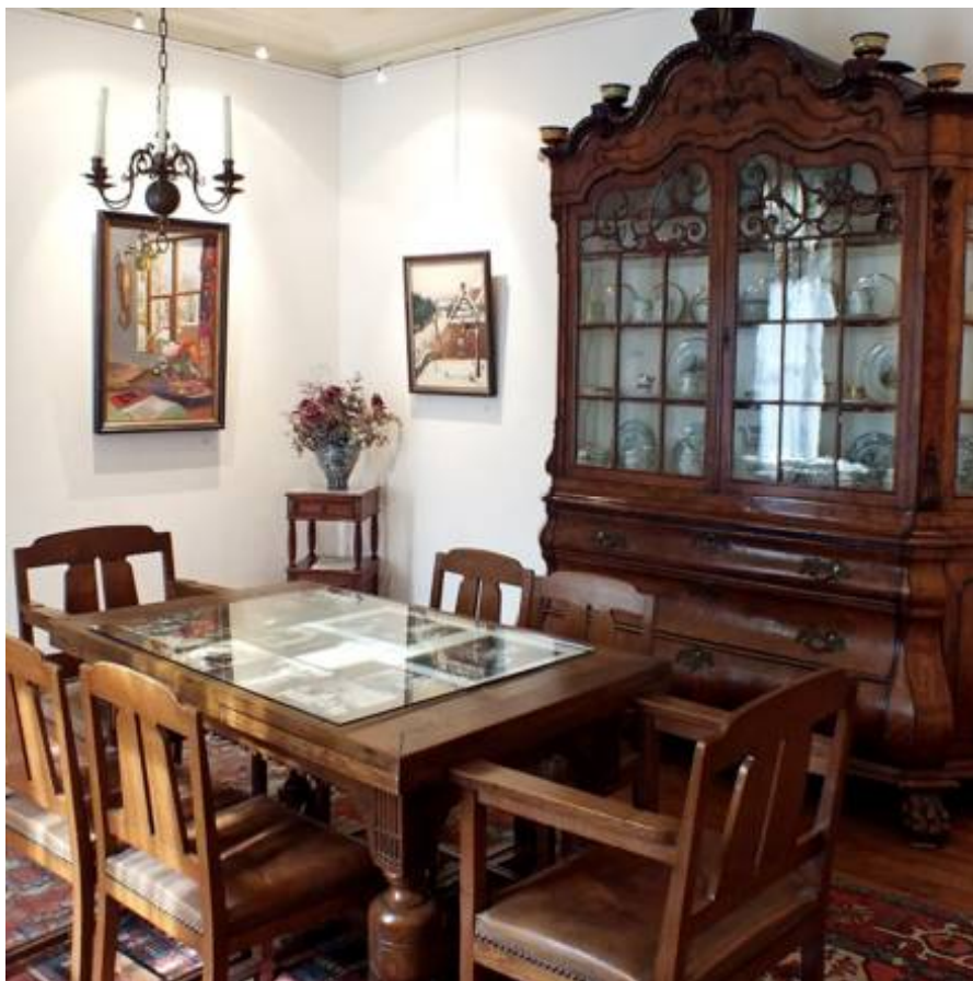
de goekamer in het Heestershuis