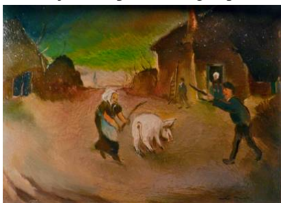
Varken naar de slacht, ca 1940

In deze jaren exposeert de gerepatrieerde Kraysen in