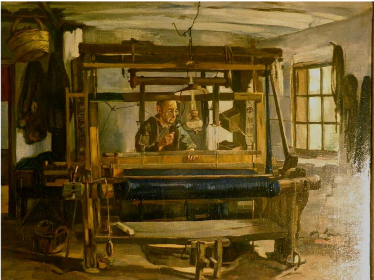
De ‘Brabantsche wever’ door de Stichting verworven in maart 2014