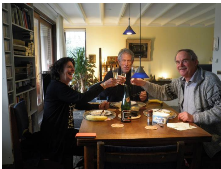
Toost tijdens de lunch bij het samenstellen van de 50 e !