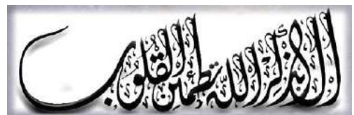
Tekst van een soerja uit de Koran

In de Islamitische cultuur worden talloze gekalligrafeerde versies van de Koran bewaard en ook in China en Japan wordt de kalligrafie gezien als een zelfstandige kunstvorm. De Chinese kalligrafie staat zelfs sinds 2009 vermeld op de lijst van meesterwerken van het orale en immateriële erfgoed van de mensheid van UNESCO.