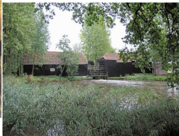
Collse watermolen foto