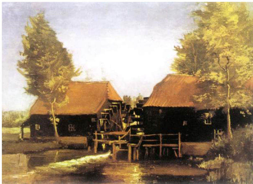
'Collse Watermolen' door Vincent van Gogh