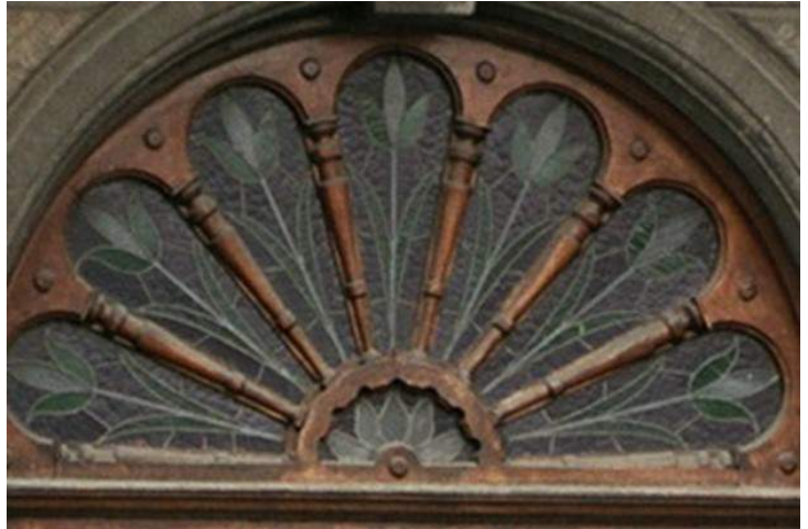
Een hangend ornament op de stijlen van de lijst in de vorm van een langgerekte wortel.

Cornelis de Vriendt maakte de val van Antwerpen in 1585 niet meer mee, hij overleed in 1575, maar drukte met zijn noordelijke renaissancestijl wel zijn stempel op de stad.