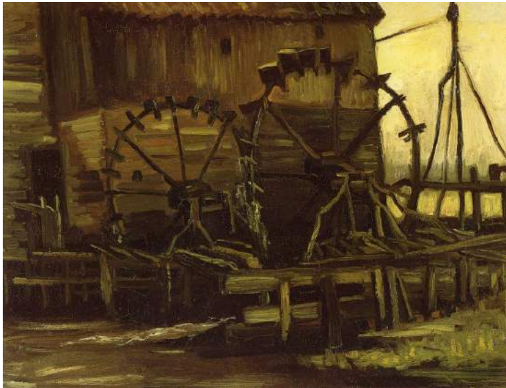
'De raderen van de Genneper watermolen' Van Gogh