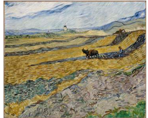
'Ploegende boer' Van Gogh: Museum of Fine Arts Boston

Vincent stond op dat moment op de toppen van zijn kunnen, een paar maanden eerder had hij zijn bekende 'Sterrennacht' geschilderd. Begin oktober zou hij een vrijwel even grote pendant schilderen van een ploegende boer in bijna dezelfde compositie (JH 1794), nu in Boston in het Museum of Fine Arts. Een belangrijk verschil met het pas geveilde werk is dat hier het gele, nog niet geploegde deel van het veld dominant is.