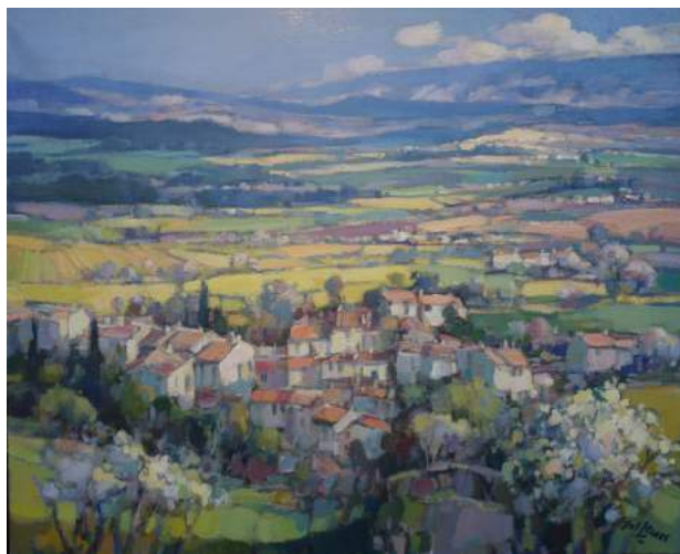
Jos Leurs: 'Saint-Saturnin, Vaucluse'