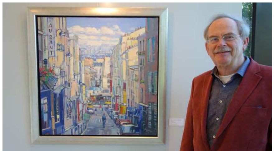
Jos Leurs: 'Rue Tholozé in Montmartre'