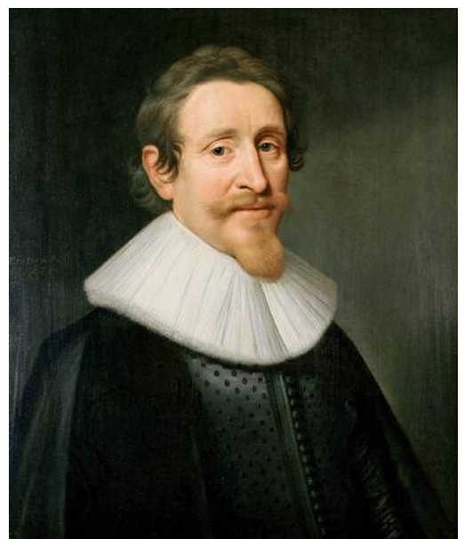
Hugo de Groot 1583-1645