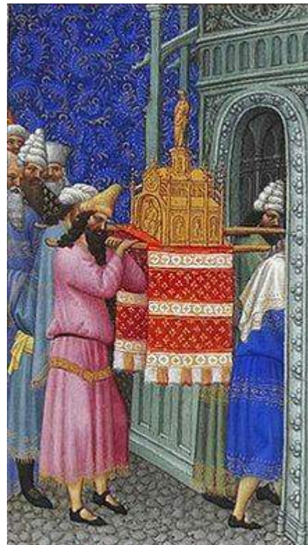
De Ark van het Verbond wordt de tempel van Salomo in gedragen

Volgens het Bijbelboek I Samuël roofden de Filistijnen eens de ark en zetten de kist in de tempel van hun god Dagon, als blijk van overwinning op de god Jahweh. Maar het beeld van Dagon viel hierna steeds om, en boog als het ware zo voor de God van de joden. Toen er ook nog allerlei rampen over de Filistijnen kwamen, was het pleit snel beslist: de kist werd gauw teruggegeven aan de Israëlieten.