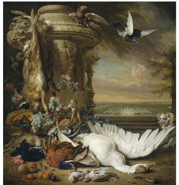
Jan Weenix: 'Stilleven met in het verschiep Rijkdorp'

Tot de collectie van het Rijksmuseum behoort 'Stilleven met in het verschiep Rijkdorp bij Wasseenaar' uit 1714 van Jan Weenix (1642 – 1719), zoon van bovengenoemde schilder. Linksboven hangt een geschoten haas, op de vloer liggen onder andere een dode fazant en een witte eend met uitgeslagen vleugel. Het bijzondere van dit schitterende jachtstilleven is dat aan de rechterkant ruim baan wordt gegeven aan een parklandschap met villa en verderop duinen en de zee onder een oranje hemel. Het schilderij was dan ook een opdracht van de landgoedeigenaar.