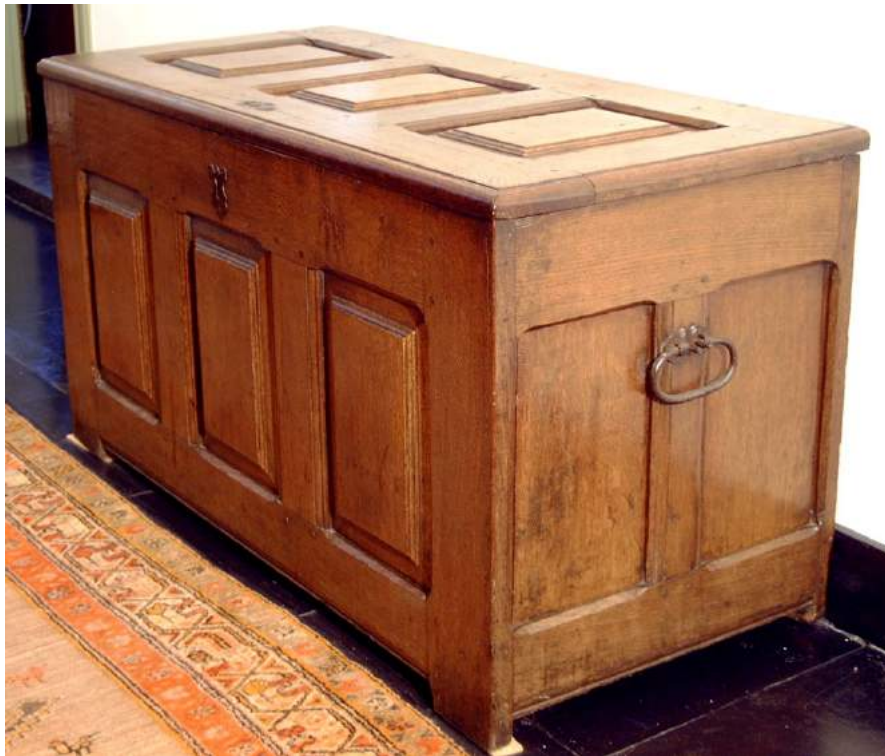
De dekenkist in de gang van het museum.

Omdat kisten draagbaar moesten zijn, kwamen aan de zijkanten handgrepen. Ze werden immers voor waardevolle voorwerpen gebruikt, zoals dekens en kleding, die men in veiligheid moest kunnen brengen. Schatkisten werden voorzien van imposante sloten. Meubelkisten werden nog lange tijd gemaakt, ook na de komst van de ladekast, vooral op het platteland.