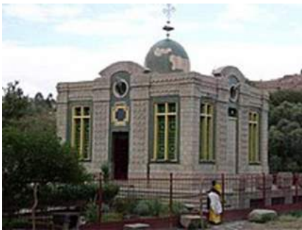
Kathedraal Onze Heilige Maria van Zion in Aksum