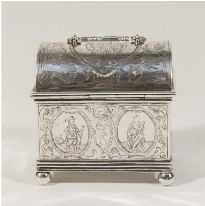
Knottekistje 17e eeuw

Het gebruik van knottekistjes in Friesland - vanaf de zestiende eeuw- is verwant met dat van de bruidskist. Hier waren die kistjes het symbool van een huwelijksaanzoek. Een jongeman gaf zijn geliefde een prachtig bewerkt kistje met daarin een mooie doek met een knoop ('knotte'), met daarin dan weer een of enkele geldstukken. Nam het meisje het kistje aan, dan gold dit als het accepteren van het huwelijksaanzoek en waren ze daarmee verloofd. De geldstukken mocht ze houden, het kistje zelf moest ze helaas meestal wel teruggeven. Deze kistjes waren klein, soms verzilverd of anderszins mooi bewerkt en soms meer waard dan de inhoud. De afbeeldingen op de kistjes waren meestal referenties aan de liefde en het huwelijksleven, soms ook Bijbelscènes die de vrouw herinnerden aan de plichten binnen het huwelijk. Onlangs werd zo'n knottekistje nog bij Kunst en Kitsch op ongeveer 15.000 Euro geschat.