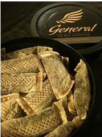
Snuiftabak in poedervorm

In Nederland wordt snuiftabak niet veel meer gebruikt, nog wel iets meer in Duitsland, Denemarken en Frankrijk. In Marokko daarentegen is het gebruik van snuiftabak nog steeds populair en ook Nederlandse jongeren van Marokkaanse afkomst gebruiken soms snuiftabak. In Kaap Verdië gebruiken oude mensen snuiftabak als middel tegen verkoudheid. In Zuid-Duitsland wordt snuiftabak Schmei genoemd en daar is het bedrijf Pöschl gevestigd, momenteel de grootste snuff-producent ter wereld.