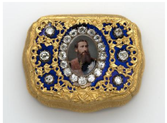
Snuifdoosje met een afbeelding van Leopold II

De eerste snuifdozen leken op tabaksdozen, maar het verschil was dat het deksel van een snuifdoos een scharnier had, want het dekseltje diende ook als hulpmiddel voor het snuiven van de tabak; zo werd er minder gemorst met het fijne en dure poeder. Er kwam een enorme productie van snuifdozen op gang, uitgevoerd in koper, zilver, verzilverd en in (soms kostbare soorten) hout, glas, email, hoorn van het hertengewei en schelpen en soms zelfs in boomschors en keramiek.