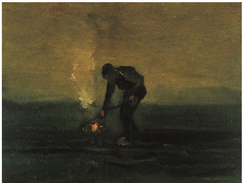
Vincent van Gogh: 'Boer, onkruid verbrandend'