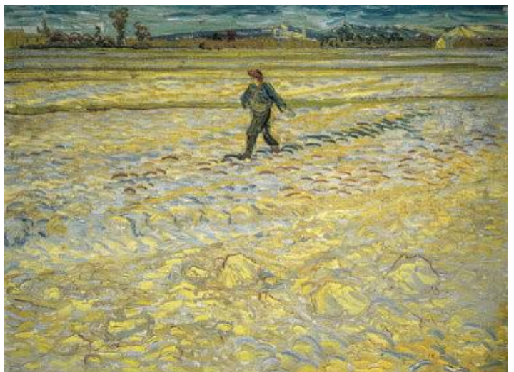
Vincent van Gogh: 'Zaaier in La Crau'