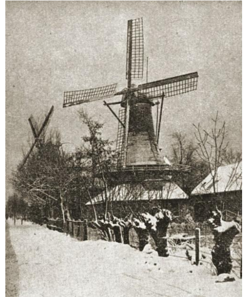
De Lelie met op de achtergrond De Ster.

In de wijk Kralingen in Rotterdam staan heden ten dage nog twee authentieke operationele snuifmolens, genaamd 'De Lelie' en 'De Ster'. Het zijn de enige nog in Nederland en waarschijnlijk van de hele wereld. De molens waren oorspronkelijk in bezit van de familie Hooien en zijn nu eigendom van de gemeente Rotterdam. In deze molens wordt nog op de oude manier snuiftabak gemaakt. Hele, gedroogde tabaksbladeren worden eerst gesausd om de tabak een specifiek karakter te geven met een mengsel van kruiden. Soms ook met andere toevoegingen zoals keukenzout, dropwater, potas, rozenwater of jeneverbessap. De tabaksbladeren worden daarna in linnen gewikkeld en strak dichtgebonden. Na de fermentatie (biologische materialen omzetten door gebruik van bijvoorbeeld bacteriën, celculturen of schimmels) worden ze in de snuifmolen fijngehakt of fijn geraspt. Het komt ook voor dat de gedroogde bladeren meteen bewerkt worden. Deze twee windmolens zijn ook bekend onder de naam 'Het Snuifmuseum'. De Ster en De Lelie zijn elke tweede zaterdag van de maand in bedrijf en dan ook te bezichtigen. Daarbij wordt uitleg gegeven over de productie van snuif en het malen van specerijen.