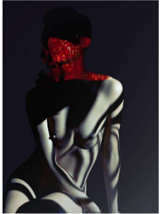
Carli Hermès / Reflections serie / Mask

Een aantal portretten vallen in de categorie 'Reflections' (2012). Een van de mooiste daarin is naar mijn smaak 'Muse', een portret in rood, zwart en wit. De marmerwitte linkerkanten van gezicht en schouderpartij contrasteren scherp met het zwart van een fors kapsel en de rechterkant van haar lichaam. Het wazige rood op gezicht en lijf verbreekt de monotonie en maakt dit portret spannend. Het siert ook de omslag van het lijvige fotoboek 'CARLI HERMÈS three decades of uncompromising photography' (2016), waarin zijn belangrijkste werken van de laatste dertig jaar staan afgebeeld. Overigens is dit schitterende boek in groot formaat nu in het museum voor gereduceerde prijs te koop. Een ander prachtig werk behorend tot dezelfde serie vind ik het portret 'Mask' van een zittende vrouw met rode kin en hals. Het zwartwitte, zebra-achtige lijnenspel op haar naakte lichaam benadrukt juist de fraaie vormen ervan.