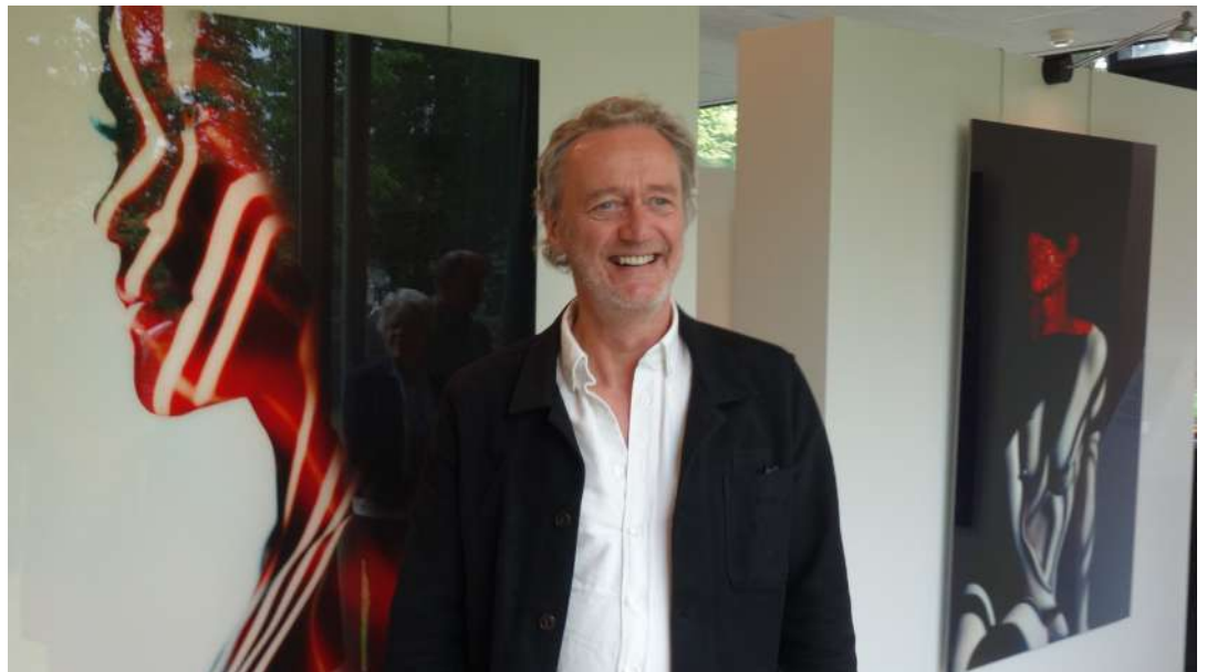
Carli Hermès tijdens de opening van de expositie in Museum Jan Heestershuis

Sinds 19 mei loopt in het paviljoen en het atelier van Museum Jan Heestershuis de expositie 'Carli Hermès Portraits'. Topfotograaf Hermès heeft daarvoor een kleine twintig portretten van vrouwen uit zijn artistieke, autonome oeuvre geselecteerd. Doordat hij werkt met verrassende kleuren, vlakverdelingen, sluiers en attributen krijgen de portretten meestal een surrealistisch karakter. Tijdens de opening ving ik vele lovende geluiden op over de tentoongestelde werken, maar ook enkele kritische. Dit ligt geheel in lijn met de reputatie die deze fotograaf-kunstenaar heeft opgebouwd. Na exposities in binnenland (met name het Groninger Museum, het Coda Museum in Apeldoorn en vele kunstbeurzen) en buitenland (onder andere in de VS) is een deel van zijn artistieke oeuvre nu voor het eerst te zien in het museum in zijn geboorteplaats. Tijdens de opening zei Carli Hermès daar erg trots op te zijn. En natuurlijk is het voor het Museum Jan Heestershuis eervol om werk van zo'n internationaal bekende fotograaf-kunstenaar te kunnen exposeren.