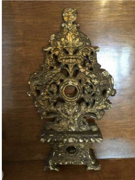
Een van de twee houten reliekhouders

In het achterste deel van de kamers-en-suite in het Jan Heestershuis staan, voor het raam, twee identieke houten reliekhouders (64 cm hoog 35 cm breed) uit het bezit van Jan Heesters. De objecten zijn wellicht ooit bij ceremoniële gebeurtenissen gebruikt want er zijn beschadigingen. Ze zijn vervaardigd rond het jaar 1800, gesneden uit lindenhout en daarna bewerkt met goudverf. In het hart zat voorheen voor de holte glas, hierin werd een relikwie of een hostie bewaard. Waarschijnlijk zijn ze ooit als monstransen met daarin een hostie of als reliekhouders met resten van heiligen in processies megedragen. Tijdens het zogenaamde Rijke Roomse Leven, waarvan het triomfalistische hoogtepunt in de jaren dertig viel, droegen katholieken hun geloof uit in uitbundige kerkelijke feesten. Maar ook later werden er nog veelvuldig processieoptochten georganiseerd. Vaak in de maand mei, waarbij meisjes hun mooie communiejurkje nog een keer aan mochten. Alleen dat al was een feest.