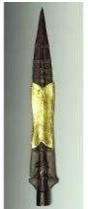
De heilige lans

Zelfs Hitler (1889-1945) is gefascineerd door deze relikwie wanneer hij in 1912 de opera van zijn geliefde componist Richard Wagner ziet, waarin Parsifal probeert de lans te veroveren. Hij zou geheel in trance zijn geraakt en de lans wordt daarna een obsessie voor hem. Hoewel er op verschillende plaatsen heilige lansen bewaard worden, is hij ervan overtuigd dat de lans in Wenen de echte is. Jaren later, na de Anschluss van Oostenrijk in 1938, haalt Hitler als eerste daad de Heilige Lans uit het Hofburgpaleis in Wenen en laat de relikwie in een gepantserde wagen overbrengen naar de kathedraal van Neurenberg.