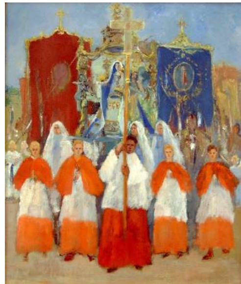
Jan Heesters, Processie

Hoewel vaak oogluikend toegestaan, hebben overtredingen van het verbod tot in de jaren vijftig van de vorige eeuw voor de nodige onrust gezorgd. Het leidde tot verschillende processen, waarbij het zelden tot een veroordeling kwam. De moeilijkheden rond processies verminderden in de jaren zestig; de kerkelijke oecumene veranderde en ook gingen protestanten er zich minder aan storen. De Grondwet van 1983 stelt nog wel in artikel 6 dat wettelijke regels kunnen worden gesteld ter zake van 'godsdienstuitoefening in de openlucht ter bescherming van de gezondheid, in het belang van het verkeer en ter bestrijding of voorkoming van wanordelijkheden'. Het katholieke België heeft nooit een processieverbod gekend.