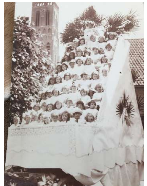
Een processiewagen vol bruidjes (1926)

Een katholieke processie vertrekt vanuit de kerk door de deur aan de noordzijde. Een misdienaar of acoliet gaat voorop met het processiekruis gevolgd door een of meer priesters en flambouwdragers. Anderen dragen beelden, vaak rijk geborduurde processievaandels en relikwieën of monstransen onder een baldakijn (processiehemel). Er lopen vaak veel jonge meisjes mee in mooie jurken. Zingend en biddend trekt men door de straten. Aan de zuidkant van de kerk komt men, nog steeds zingend, de kerk weer binnen.