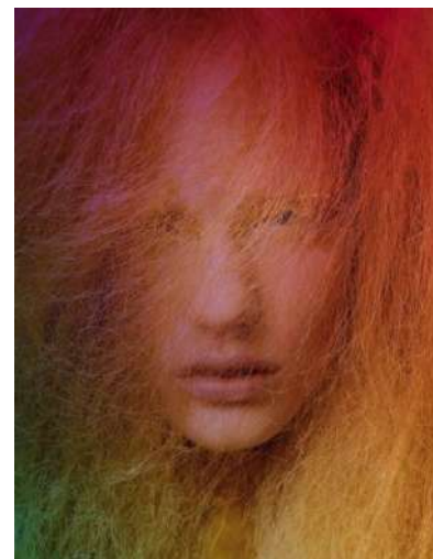
Carli Hermès / Candy Shop serie / Beautiful Red

Wel weer interessant vind ik 'Coming Out' uit dezelfde serie. Het felle blauw en zwart daarop, verrassend diagonaal van elkaar gescheiden, van een vrouw met knalrode tong levert naar mijn idee een sterk portret op. Veel bezoekers in het museum blijken gecharmeerd te zijn van 'Beautiful Red' waarop een meisjesgezicht bijna geheel bedekt is door een fijnmazig net van oranjegele haartjes. Het behoort overigens ook tot deze serie 'Candy Shop'.