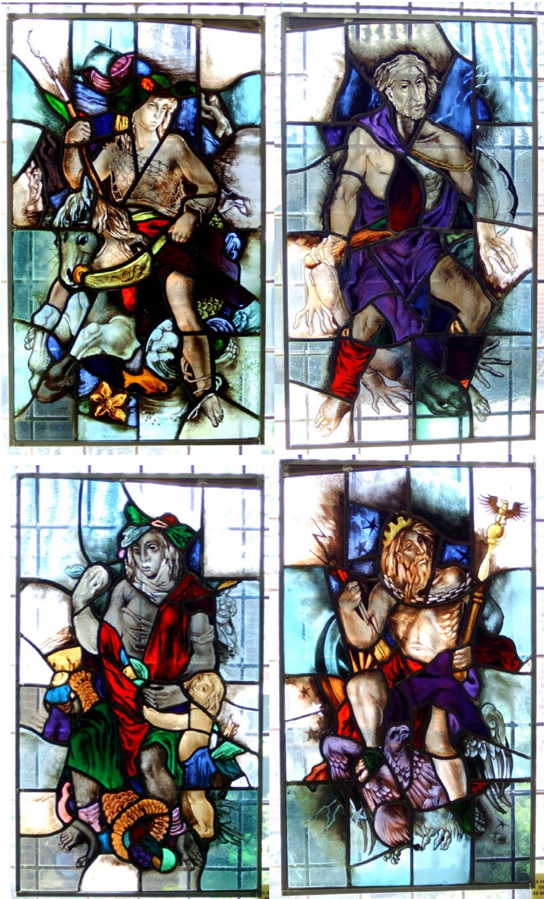
De vier elementen in de Heesters-ramen van M.H. Duys: linksboven: WATER rechtsboven: VUUR linksonder: AARDE rechtsonder: LUCHT