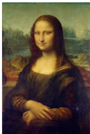
Mona Lisa Parijs