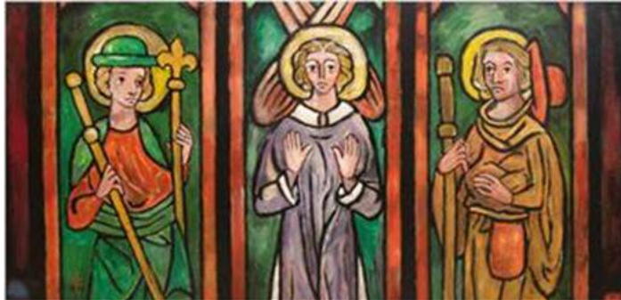
Marien Kirche Lubeck, Lothar Malskat