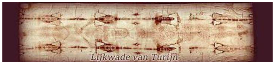
Lijkwade van Turijn

Maar er is nog meer dubieus: onder andere het baarkleed van Maria dat in meerdere kerken wordt bewaard, de Lijkwade van Turijn, waarvan aangetoond werd dat die stamt uit de periode 1260-1390, en de Heilige Lans, (het exemplaar in Wenen heeft een spijker die ook werkelijk uit de tijd van de kruisiging is) maar ook daarvan zijn meerdere exemplaren.