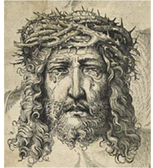
Hans Burkmaier sr.; 'Doek van Veronica'; plm.1500

Volgens dit stuk zou keizer Constantijn (272-337) het wereldlijk gezag over zijn rijk overgedragen hebben aan paus Silvester I als dank voor zijn genezing van lepra. Pas in de vijftiende eeuw wordt aangetoond (door geleerden van het Vaticaan nota bene) dat het om een vervalsing gaat. Desondanks wordt dit document door veel pausen nog gebruikt om hun verloren macht op te eisen.