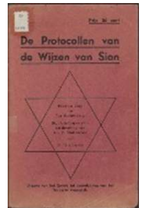
Boek 'De Protocollen van de Wijzen van Sion'