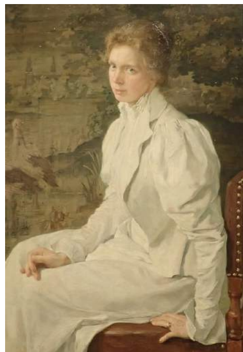
Pieter de Josselin de Jong; 'Portret van Jeltje' 1902; olieverf; 75x57 cm

In 1985 was er een expositie van zijn werk in zijn geboortedorp. In 1996 maakten zijn schilderijen en aquarellen deel uit van de grote overzichtstentoonstelling 'De Muze als Motor' in het Noordbrabants Museum over tweehonderd jaar Beeldende Kunst in Brabant.