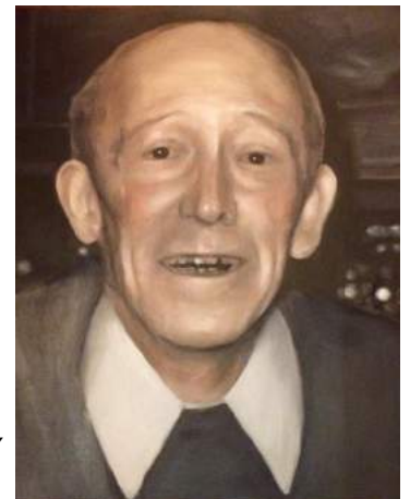
Monique Broekman; 'Cafébaas aan het kanaal' Den Bosch; olieverf op paneel; 30x25 cm

In de documentaire filmpjes waarin die mensen hun verhaal vertellen en die nu her en der in het museum continu vertoond worden, kunnen we de geschilderde portretten met hun 'levende' uiterlijk vergelijken. We constateren dan hoe goed die olieverven geslaagd zijn! De filmpjes maken duidelijk hoezeer de voortdurende aanwezigheid van het kanaal een stempel op de levens van velen heeft gedrukt.