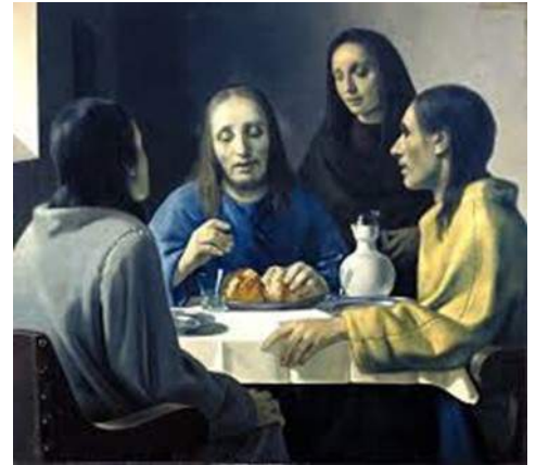
'De Emmaüsgangers', gekocht door Boymans van Beuningen

Na de oorlog wordt hij opgepakt voor collaboratie en hoewel hij alleen de vervalsing van dit ene schilderij had kunnen opbiechten, laat hij Nederland schrikken. In een opzienbarend proces toont hij hoe hij vele vervalsingen maakte. Van Meegeren wordt ontmaskerd maar ook de gevestigde orde van kenners in de kunstwereld gaat compleet af.