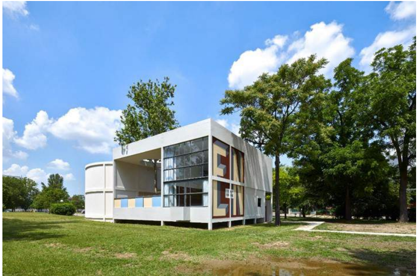
Le Corbusier, 'De Nieuwe Geest'

Het is een functioneel gebouw, met veel glas en een hoog plafond. Bijzonder is dat het gebouw om een boom heen wordt gebouwd. Le Corbusier vindt dat de tijd van decoratie voorbij is. Hij noemt zijn paviljoen 'De Nieuwe Geest' want het nieuwe leven vindt plaats in het machinetijdperk. Zijn gebouw veroorzaakt een schandaal. Mensen schrikken van zo'n praktisch ontwerp zonder decoratie en het meubilair erin vinden velen saai en lelijk.