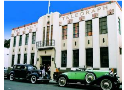
Straatbeeld in Napier

In 1931 wordt door een aardbeving een groot deel van de stad Napier in Nieuw-Zeeland verwoest, met vele doden. Het hele centrum wordt direct weer opgebouwd, nu in Art Deco stijl. In 2007 is Napier hiervoor genomineerd voor de Unesco Werelderfgoedlijst, dit is nog steeds prachtig om te zien.