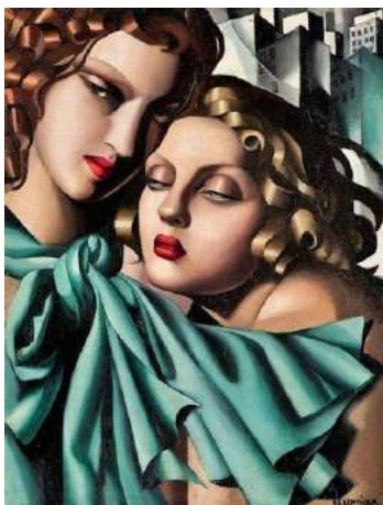
Tamara de Lempicka

Ook de Poolse Tamara De Lempicka exposeert in 1925 in Parijs, ook zij is beïnvloed door de nieuwe stroming. Met haar eigen stijl en gestileerde vormen geeft ze de tijdgeest aan: het gegoede leven van de elite in de jaren twintig.