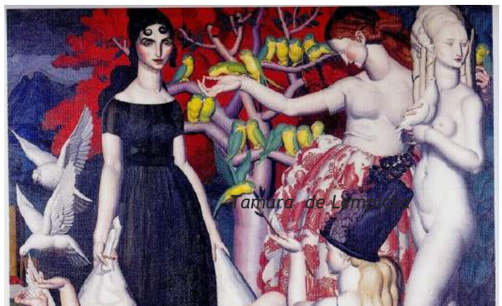
Jean Dupas toont zijn beroemde Les Perruches op de tentoonstelling van 1925

Maar ook veel beeldende kunstenaars als Miro, Matisse en Picasso, beïnvloed door de nieuwe stijl, zijn in Parijs te zien.