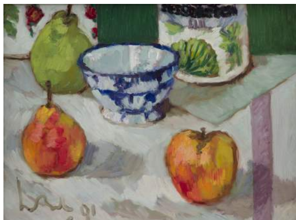
Kees Bol; Stilleven fruit en blauwe kom; 1991

"Zonder voorbeeld ontwikkelde zich het talent van Kees Bol: een schijnbaar ongecompliceerd soort schilderen dat echter meer strakheid, meer inzicht en doordenken verraadt dan men op het eerste gezicht meent."