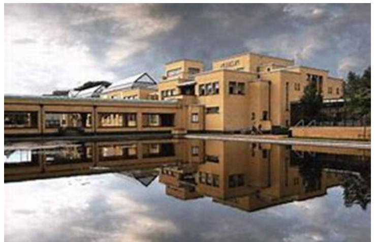
Kunstmuseum Den Haag

Door symmetrie en verhoudingen zal Berlage een tijdloze schoonheid creëren. Speciaal voor het museum laat hij bakstenen van 22 x 11 x 5,5 centimeter bakken. Die 11 cm wordt leidend voor het hele gebouw. Het gebouw bestaat uit vierkanten en kubussen met zijden en ribben van 110 cm en de roedeverdeling van de ramen meet 4 keer 11 centimeter. De vitrines op de afdeling kunstnijverheid zijn ook een veelvoud van 11 cm, waardoor een harmonieus geheel ontstaat. Oogt het gebouw aan de buitenkant sober, binnen is het verrassend anders door het gebruik van luxe materialen en rijke decoratieve meubels.