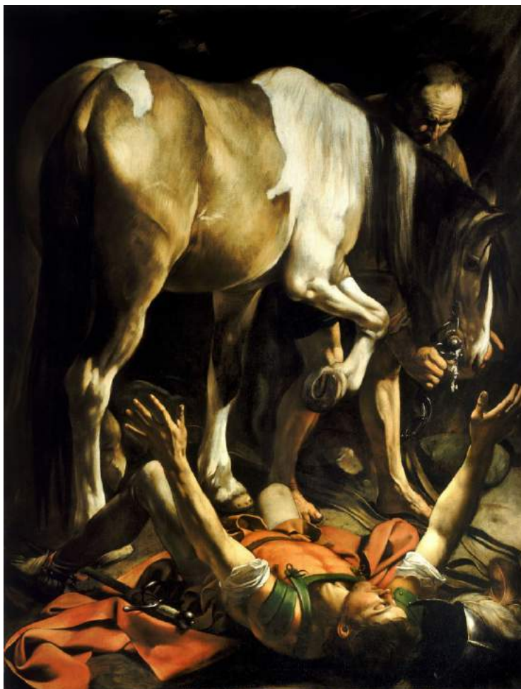
Caravaggio: 'De bekering van Paulus'