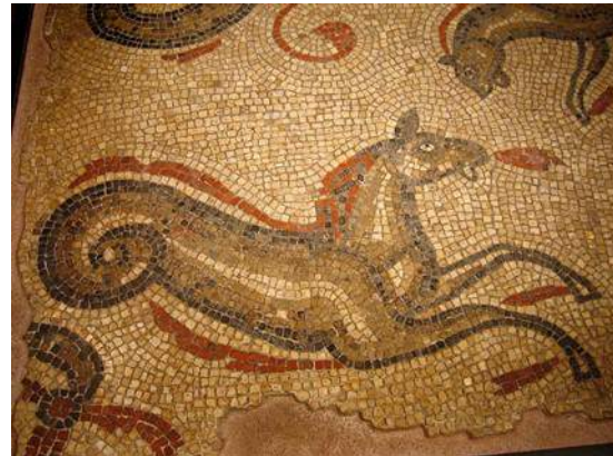
Hippocampus Aqua Sulis Engeland

Het zeepaard zou het hoofd en de voorbenen van een paard hebben, het geschubde onderlijf van een vis en de staart van een dolfijn. Zo is ook het zeepaard op de trap in het museum uitgebeeld. Dit paard zou zwemmen met zijn staart. Er zijn ook voorstellingen van zeepaarden die geen hoeven hebben maar poten met vliezen, geen manen maar vinnen en soms ook met vleugels of een hoorn als de eenhoorn. Al deze paardenrassen zouden in de zeeën leven.