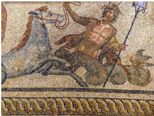
Hippocampus Efeze Turkije

Een zeepaard is de mythische tegenhanger van het gewone landpaard. Het komt vaak voor dat fabeldieren simpelweg zeevarianten van echte dieren zijn. Zo zijn er ook voorstellingen van zee-ape en zeevarkens bekend.