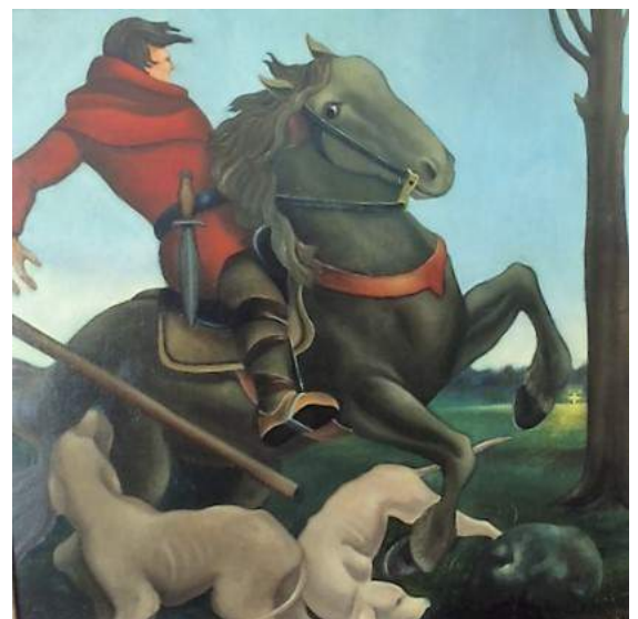
Sjef van Schaijk: 'Paulus ziet een lichtend kruis'

Op wederom monumentale wijze beeldt hij op zijn schilderij 'Paulus ziet een lichtend kruis' (98x98 cm particuliere collectie) de vervolger van de christenen uit op het moment dat hij getroffen wordt door het felle licht van een stralend kruis in de verte. Van Schaijk schildert de latere apostel Paulus (voor zijn bekering nog Saul of Saulus geheten) op een galopperend zwart paard, dat plots met verwilderde blik steigerend tot stilstand komt. Verbijsterd door het 'goddelijk' licht laat Saulus zijn lans vallen en stort hij ter aarde. Onder invloed van deze gebeurtenis zal hij zich volgens het Bijbelverhaal bekeren en juist een felle voorvechter worden van het christendom.