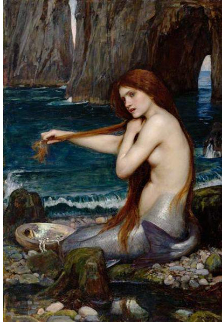
John Waterhouse: 'The mermaid'; 1900

Al vanaf de tijd van de oude Grieken zijn er duizenden ontmoetingen beschreven met mensen die in zee zouden leven. Verleidelijke vrouwen en mannen met een visstaart, soms vriendelijk, soms erotisch maar vaak ook gruwelijk. De Katholieke Kerk gebruikte de gespleten persoonlijkheid van zeemeerminnen - half vrouw, half vis - als symbool voor verleiding van het kwaad.