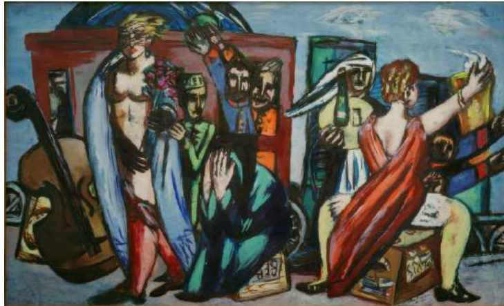
Max Beckmann, De reis, 1944, Part.Coll.