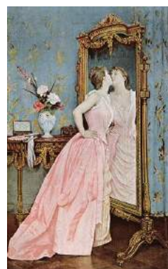
Toulmouche, Vanity , 1890