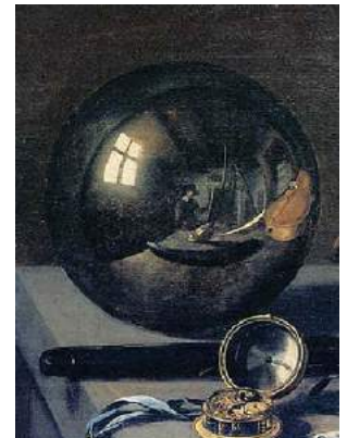
Pieter Claesz, ca. 1628 (detail)

Vooral bij afbeeldingen van naakte vrouwenlichamen zien kunstenaars al snel de mogelijkheden.