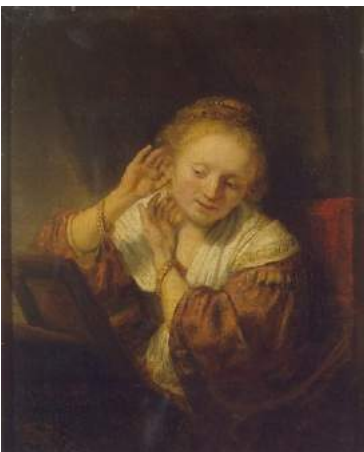
Rembrandt, De courtisane, 1606-1669

Een spiegel geeft door de dieptewerking niet alleen een extra dimensie, maar zorgt ook voor speciale effecten. Rembrandt (1606-1669) schildert al een vrouw die zich onbespied waant, kijkend in een spiegel naar haar oorbellen. Het lijkt alsof het moment gevangen is: als op een foto.