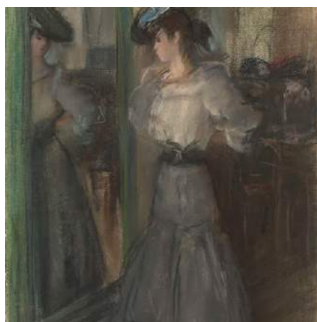
Isaac Israëls, Meisje voor een spiegel, 1865-1934