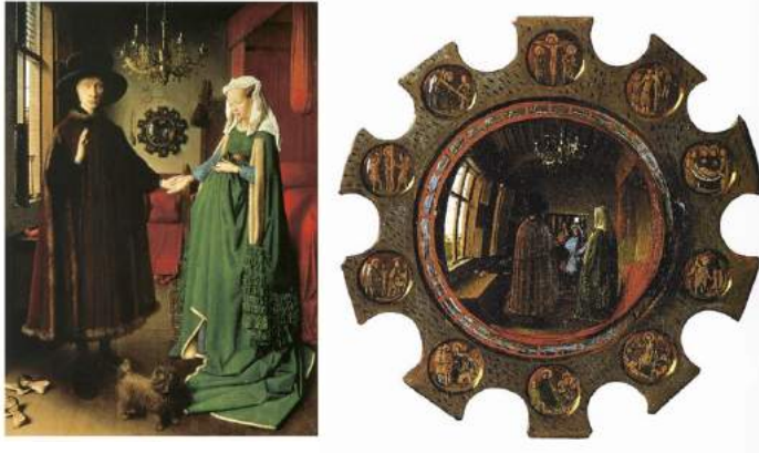
Jan van Eyck, Portret van Giovanni Arnolfini en zijn vrouw, 1434

De bekendste spiegeltruc in de kunst is wel van Jan van Eyck. Op het schilderij Portret van Giovanni Arnolfini en zijn vrouw is achter het echtpaar een bolle spiegel te zien, die niet alleen het echtpaar weerspiegelt, maar ook nog andere figuren, misschien de schilder.