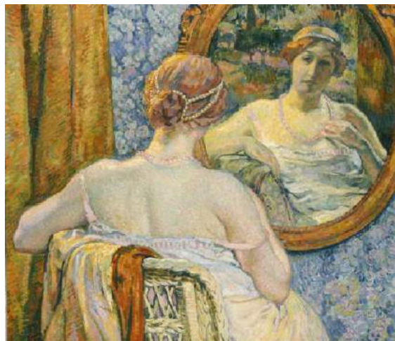
Theo van Rysselberghe, Frau beim Blick in den Spiegel, 1907

Hier houdt Van Rysselberghe de kijker prikkelende mogelijkheden voor en het idee aanwezig te zijn in dezelfde ruimte als waarin de afgebeelde vrouw is. Een effect dat versterkt wordt door de vage reflectie van de tuin in de spiegel.