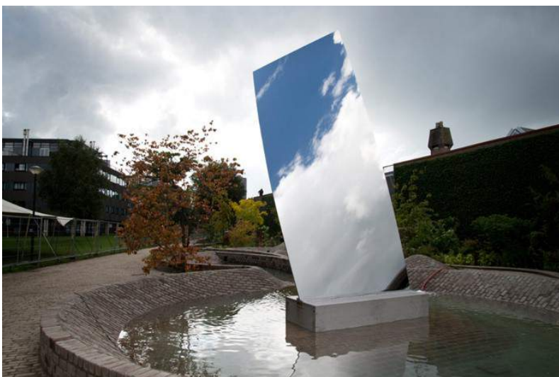
Anish Kapoor, Sky Mirror for Hendrik, 2017

Ook in Tilburg is een werk van Anish Kapoor: als Museum De Pont in 2017 25 jaar bestaat, ontwerpt hij hiervoor de Hemelspiegel Sky Mirror for Hendrik.