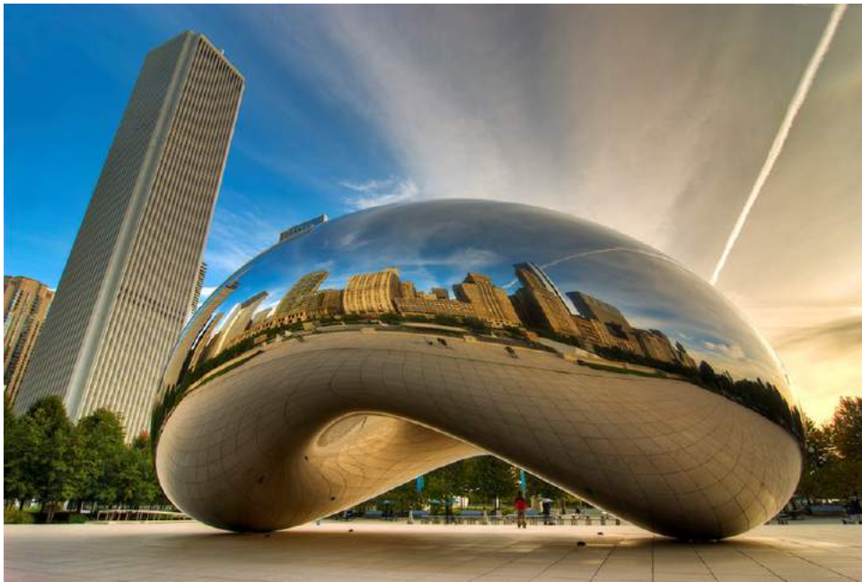
Anish Kapoor, Cloud gate, 2006

Platte, holle en bolle spiegels spreken ook nu nog tot de verbeelding. Hoewel spiegels bij uitstek geschikt zijn de werkelijkheid te tonen kunnen ze die werkelijkheid ook verdraaien. Daarom is ook in de hedendaagse kunst de spiegel een geliefd onderwerp. In Chicago is The Cloud Gate geplaatst: de spiegelende 'boon' van Anish Kapoor.