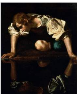
Caravaggio, Narcissus , 1597-1599