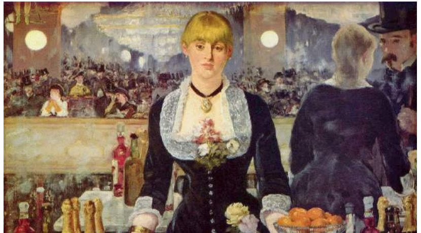
Manet, Un bar aux Folies Bergère

De spiegel achter de toog beslaat het volledige doek, waardoor het hele verlichte café te zien is. Het lijkt of je als toeschouwer zelf voor de bar staat om iets te bestellen.