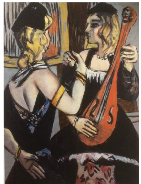
Max Beckmann, Cabaretières, 1943, Kunstmuseum Bonn

Vlak voor de bevrijding koopt het Stedelijk Museum Amsterdam het genoemde dubbelportret aan. "Ontmoeting met 'Holland' na een zevenjarig verblijf hier", is Max' ironische commentaar. Het is het enige doek dat gedurende zijn exiljaren door Nederlandse musea wordt aangekocht. Tot voor kort waren er slechts vier schilderijen van Beckmann in Nederlands openbaar kunstbezit. De laatste vijf jaar verwierven Singer Laren, Boijmans van Beuningen in Rotterdam en Kunstmuseum Den Haag elk een schilderij van hem. Momenteel loopt in laatstgenoemd museum de prachtige expositie 'Universum Max Beckmann', nog tot half mei te bezichtigen.