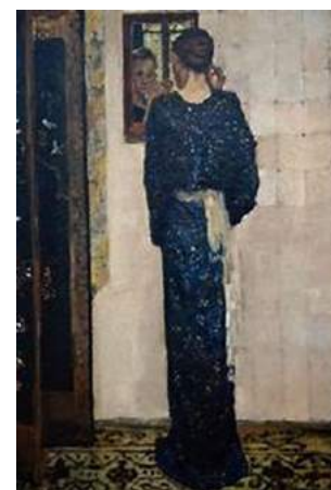
George Hendrik Breitner, Het oorringetje, 1857-1923