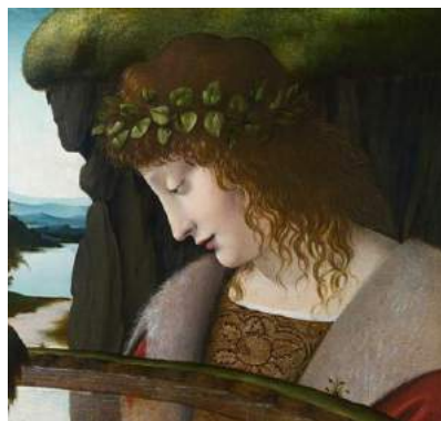
Leonardo da Vinci, Narcissus , plm 1500