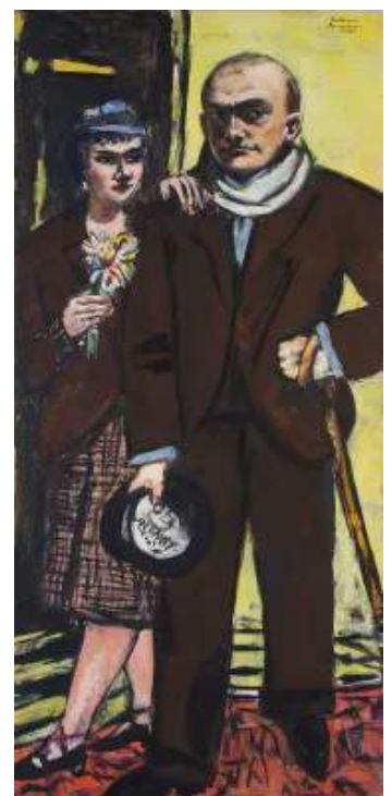
Max Beckmann, Dubbelportret Max en Quappi , 1941, Stedelijk Museum Amsterdam