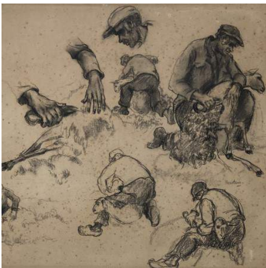
Jan Heesters, 'Schetsen'

Tot en met 30 januari loopt de expositie De Kunst van het Tekenen , die behalve in het Museum ook op locatie RAADhuis is te zien. In het Museum staan de tekeningen van Jan Heesters centraal. Een selectie uit de honderden tekeningen van zijn hand toont de diversiteit aan onderwerpen en maakt zichtbaar waar Heesters zijn inspiratie vandaan haalde. Met een schetsboek en potlood of inktpen op zak wist hij alledaagse situaties snel te vangen, in eigen omgeving en in het buitenland. Er hangen ook tekeningen uit zijn studietijd. Bijvoorbeeld de naaktmodelstudies in klassieke houdingen. Dat deze modeltekenlessen actueel blijven, is te zien op de schetsen van kunstenaar Rein van Uden. Verder bevat de expositie op beide locaties originele tekeningen van Sandra Klaassen, illustrator van prentenboeken. Haar sfeervolle prenten staan in dienst van het verhaal maar de originele tekeningen zijn ook op zichzelf zeker de moeite waard om te exposeren. In het RAADhuis is te volgen hoe het prentenboek Lot en de Draak tot stand is gekomen. Originele schetsen en ontwerp tekeningen hangen naast de uiteindelijke prenten zoals die in druk zijn verschenen. In het souterrain is hetzelfde proces van het stripboek BRABANT – DAAR BRANDT NOG LICHT , de geschiedenis van Brabant in stripvorm van Danker Jan Oreel en Henk Wittenberg te volgen van storyboard naar ontwerp schets tot ingekleurd eindresultaat.