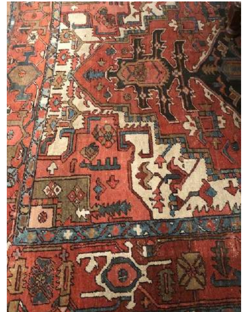
Detail kleed Goeikamer

In de Goeikamer in het Museum ligt, gedeeltelijk onder de tafel, een Perzisch tapijt. Jan Heesters koopt dit kleed waarschijnlijk om deze kamer een nog rijkere uitstraling te geven. Het kleed is geknoopt in zachte tinten, voornamelijk roze, blauw en wit.