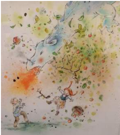
Sandra Klaassen: 'Lot en de draak'

De naakten van Heesters worden in het Paviljoen gecombineerd met enkele naaktstudies van Rein van Uden. Deze tekende en tekent hij de laatste jaren naar model als docent van een groep enthousiaste tekenaars.