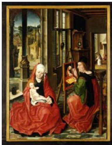
Derick Baegert; 'Lucas schildert de Madonna'; Westfalisches Landesmuseum, Munster