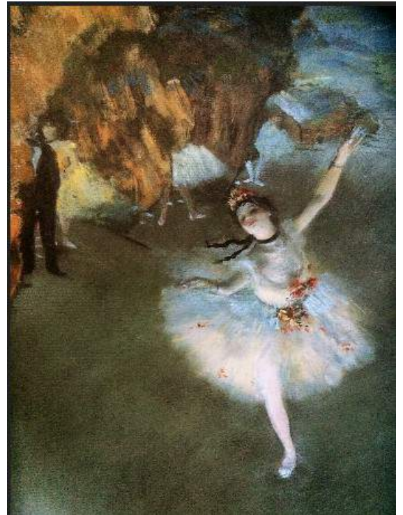
Edgar Degas; 'L'Etoile ou Danseuse sur scène'; 1876/77; pastel; 58 x 42 cm; Parijs Musée d'Orsay

Voor de danseres stond wellicht de Belgische Marie van Goethem model. Degas heeft haar bijna dertig keer getekend of in pastel uitgebeeld, naakt of in tutu, een uitstaand gazen balletrokje. Haar ouders waren van armoede in 1862 uit Brussel naar Parijs gevlucht en zouden op negen verschillende adressen nabij de huidige Place Pigalle wonen. Hun dochter Antoinette poseerde al op twaalfjarige leeftijd voor Degas.