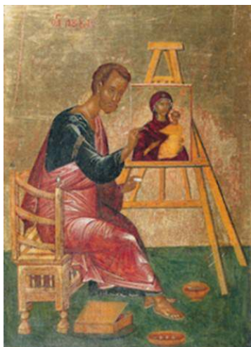
'Lucas schildert de ikoon van de moeder God's'; begin 15e eeuw; Iconen-museum Recklinghausen

De allereerste afbeelding van Maria zou volgens de overlevering geschilderd zijn door de evangelist Lucas. Tijdens het schilderen zou Maria aan Lucas verteld hebben over de geboorte en het leven van Jezus. Het evangelie van Lucas begint daarom met het geboorteverhaal in Bethlehem.