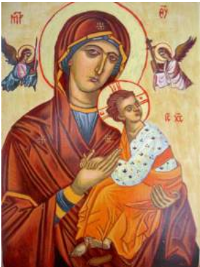
Icon; Kreta; 15e eeuw

De kleur purper, voorbehouden aan de keizers van het Oostromeinse Rijk, symboliseert de goddelijkheid van moeder en kind. De oosterse visie op Maria is een boven het volk verheven koningin-des-hemels. Dit beeld verschilt wezenlijk van de westerse iconografie. Daarin is Maria, vaak in het blauw gekleed, als een 'gewone' liefhebbende moeder afgebeeld, die dicht bij de gelovigen staat. Maria, als moeder, staat symbool voor onvoorwaardelijke liefde.