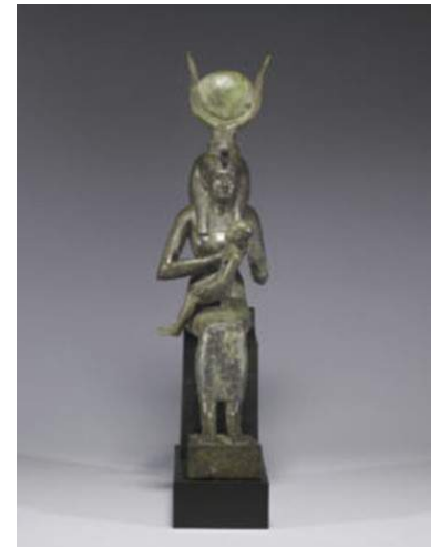
Beeld voedende Isis; 664-525 voor Chr.