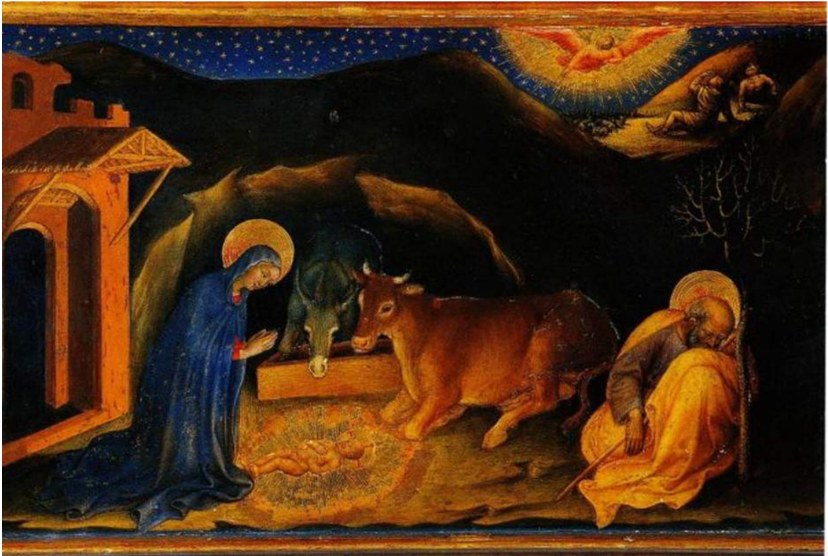
Ca 1400; Fabriano; paneel; Maria in aanbidding gekniel. Ook de os en de ezel knielen. Jozef peinst....

Once in royal David's city Stood a lowly cattle shed Where a mother led her baby In a manger for his bed Mary was that mother mild Jesus Christ her little child