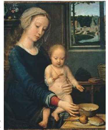
Gerard David; 'Maria met paplepel'; 1515

De kleur purper, voorbehouden aan de keizers van het Oostromeinse Rijk, symboliseert de goddelijkheid van moeder en kind. De oosterse visie op Maria is een boven het volk verheven koningin-des-hemels. Dit beeld verschilt wezenlijk van de westerse iconografie. Daarin is Maria, vaak in het blauw gekleed, als een 'gewone' liefhebbende moeder afgebeeld, die dicht bij de gelovigen staat. Maria, als moeder, staat symbool voor onvoorwaardelijke liefde.