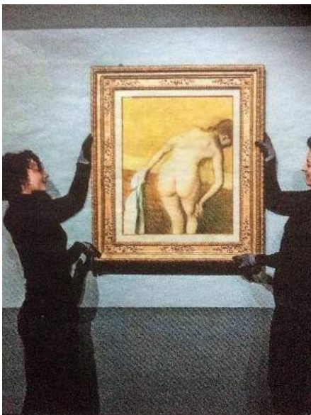
Edgar Degas; 'Badende vrouw'; 1886; pastel; ca. 60 x 50 cm; Van Gogh Museum Amsterdam

Zijn serie pastels van badende, zich wassende, kammende of afdrogende vrouwen heeft grote bekendheid gekregen. Mede omdat Vincent van Gogh er een groot bewonderaar van was, heeft het Van Gogh Museum in Amsterdam begin 2020 een werk uit die serie weten te verwerven. Daarmee ging een langgekoesterde wens van dat museum in vervulling.