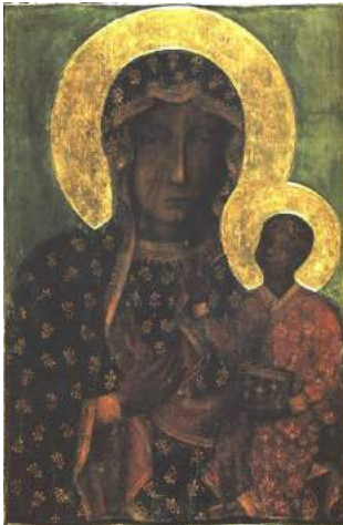
De zwarte madonna (van Czestochowa)

Op verzoek van Maria zelf wordt het schilderij daarna overgebracht naar Polen. Daar is vaak om het werk gevochten en het doek draagt nog de sporen van pijl en mes. Sinds Maria in 1655 zorgt dat de Zweedse aanvallers verdreven worden, is het schilderij het symbool van Poolse nationale vrijheidsdrang en eenheid.