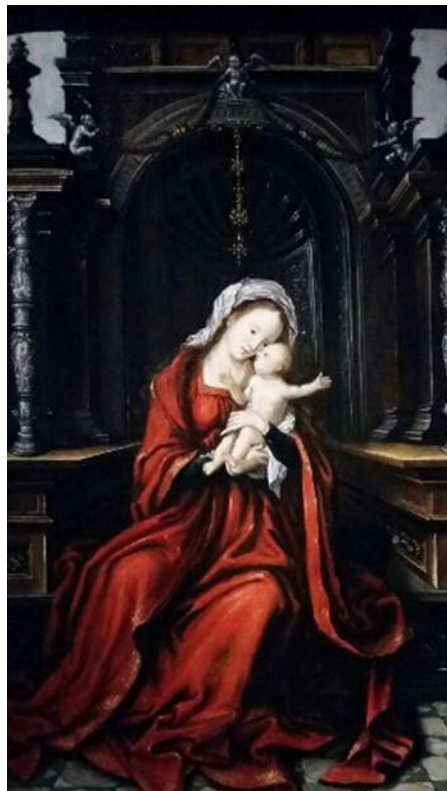
Maria met kind; 17e eeuw Zuid-Nederland