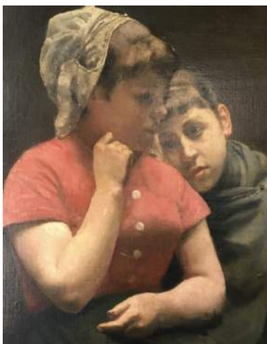
Pieter de Josselin de Jong - Twee meisjes - olieverf op doek

Tot en met 17 februari in het Museum: Expositie 'Meesters van Meierijstad'