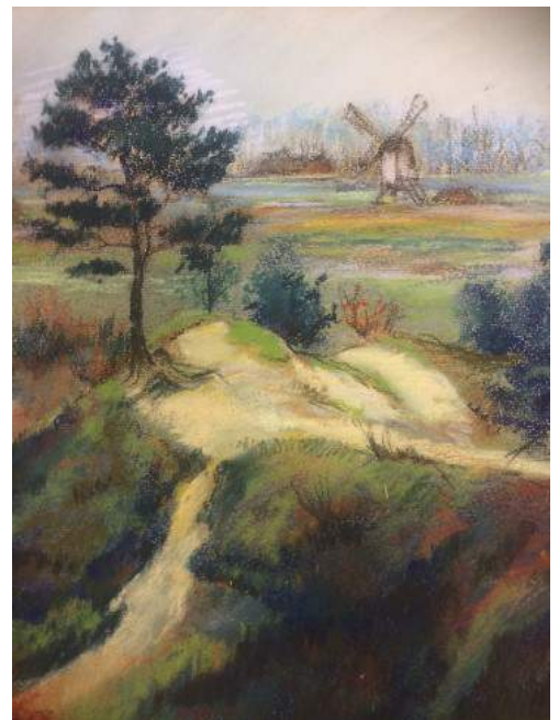
Jan Heesters; 'Eerdse bergen'; 1930; pastel; detail; privé-collectie

Deze plek, waar in 1944 tijdens Market Garden zwaar is gevochten, zelfs van man tot man, fungeert sindsdien weer als vredig recreatiegebied. Nog steeds zijn er enkele zandruggen, maar dan flink afgekalfd, waarneembaar. De voormalige Koevingse molen dateert van 1290 en stond op het 'driedorpenpunt' Veghel, St. Oedenrode en Schijndel. Momenteel treft men daar een eenvoudig herdenkingsmonument aan met molenstenen onder een fraai afdakje met drie dorpswapens. Er waren plannen voor herbouw van de molen, maar die zijn (nog) niet gerealiseerd.