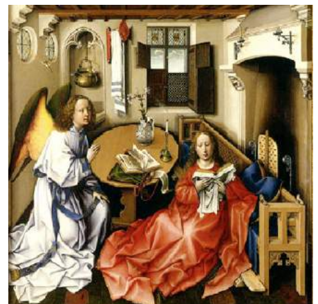
'De Annunciatie'; Meester van Flemalle