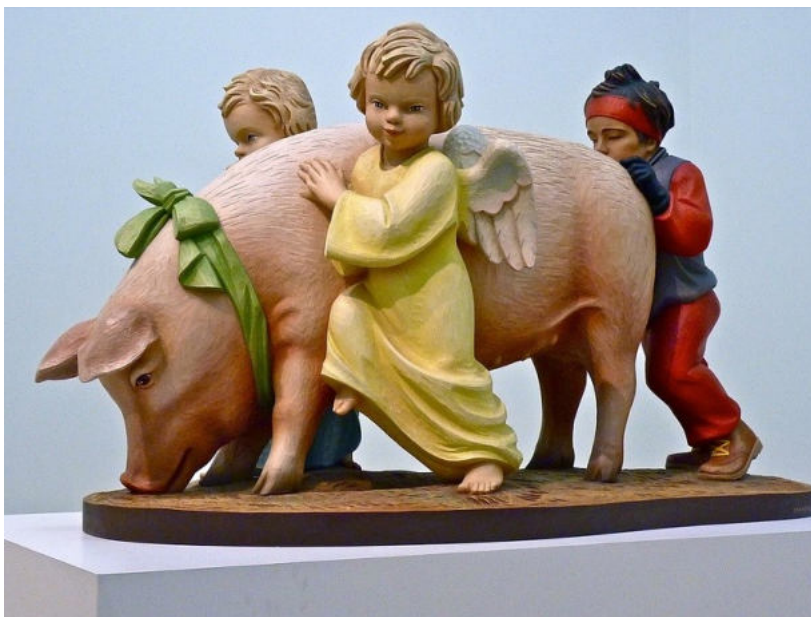
Jeff Koons 'Ushering in Banality'