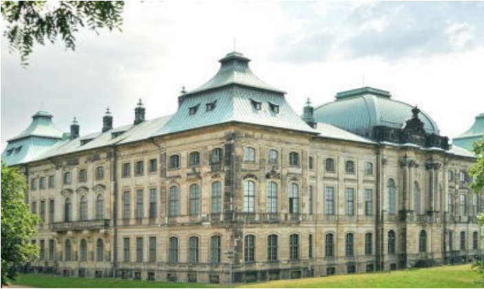
Japans Paleis Dresden (verwoest in 1945, later herbouwd)

Porselein was een obsessie voor August de Sterke. Hij bouwde een paleis in Japanse Stijl om zijn meer dan twintigduizend objecten, Chinees en Meissen porselein in onder te brengen.