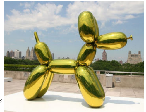
Uitvergroete ballonnenkunst, Jeff Koons

De bekende Jeff Koons (1955 VS) is een conceptkunstenaar van het postmodernisme. Hij wil de aandacht vestigen op de eenvormige smaak van mensen of misschien op de kitsch. Hij toont hiermee de eendimensionale beeldcultuur van reclame en televisie; de smaak van de massa... Maar voor critici blijft het de vraag of het zin heeft dit in musea te laten zien.