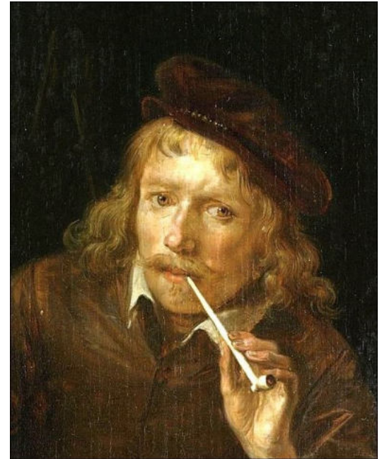
Gerard Dou 1650

Al vanaf 1617 werden er in Gouda lange pijpen vervaardigd, zoals vaak te zien op schilderijen uit de zeventiende eeuw. Deze pijpen werden gemaakt van meerschium, een bijzonder mineraal dat gevonden werd in Turkije. Geologen gaven het de naam sepioliet, deze naam werd vaak verward met sepia maar dat is het rugschild van de inktvis. Meerschium is licht van gewicht, volledig doordrenkt met water is het te snijden. In droge staat kan het bewerkt worden als een zachte houtsoort. Warmte verhardt het materiaal en daardoor is het heel geschikt voor pijpmateriaal. Meerschium heeft nauwelijks een andere toepassing gekend dan voor de productie van pijpen. Er kwam zelfs een speciale pijpenmarkt in Gouda die op de Nieuwe Haven werd gehouden. Duizenden vonden werk in de pijpindustrie en er werd veel geëxporteerd. Over de hele wereld worden resten van de Goudse pijpen gevonden. Grote concurrentie betekende aan het eind van de 18e eeuw de doodsteek voor deze industrie.