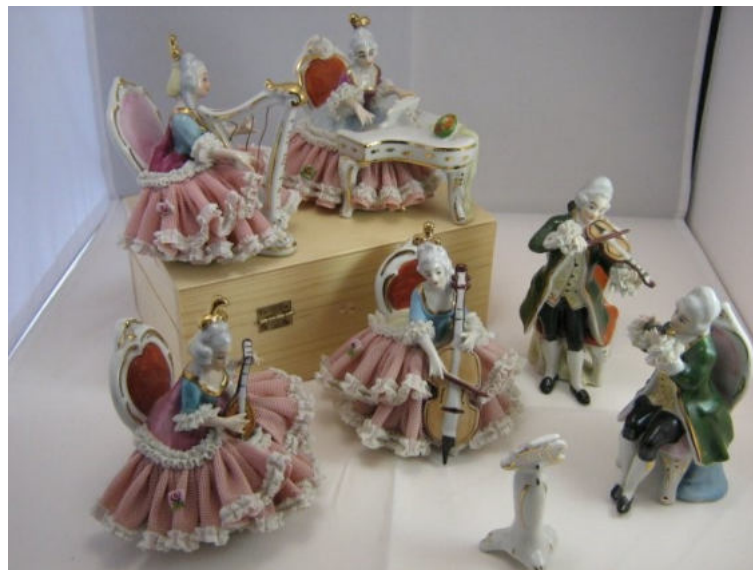
Orkest van porselein