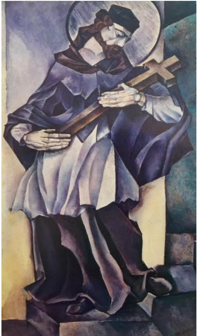
Natan Altman Heilige, kubistisch werk, 1913