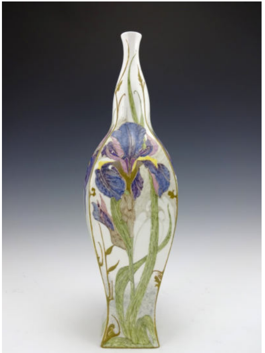
Rozenburg vaas 1903

De kritiek was vooral gebaseerd op de mening dat musea kunsttempels zijn. Men vond het ongehoord dat dit beeld voor zoveel gemeenschapsgeld werd aangeschaft omdat het volgens de heersende opinie tot de lagere kunst zou behoren. Kunstmusea zouden 'hogere' kunst moeten aanschaffen: daar zouden volgens de critici kunstwerken uit de 'elitecultuur' getoond moeten worden.