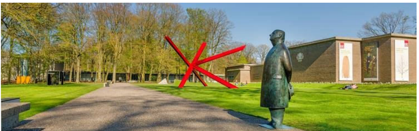
Museum Kröller-Müller. Op de voorgrond 'Meneer Jacques' van Oswald Wenckebach. In rood 'K-piece' van Mark di Suvero.