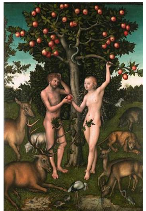
Lucas Cranach de Oude, 'Adam en Eva', 1526

De boom des levens en de boom van de kennis van goed en kwaad komen voor in het boek Genesis. Volgens de Bijbel wordt de levensboom door God geplant in de Hof van Eden. De vruchten van deze boom geven eeuwig leven. God plant ook de boom van de kennis van goed en kwaad midden in het paradijs.