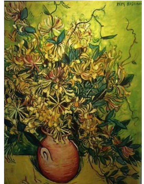
Kees Bastiaans, 'Bloemstillevens kamperfoelie'

Ook van Bastiaans treft u nog aan een clown, een stilleven met gele appels, een vroeg Brabants landschap en een veld met korenschoven.