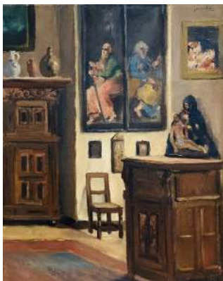
Jan Heesters, Interieur huiskamer

Tot en met 4 september in het Museum: Expositie 'Aanwinsten'.