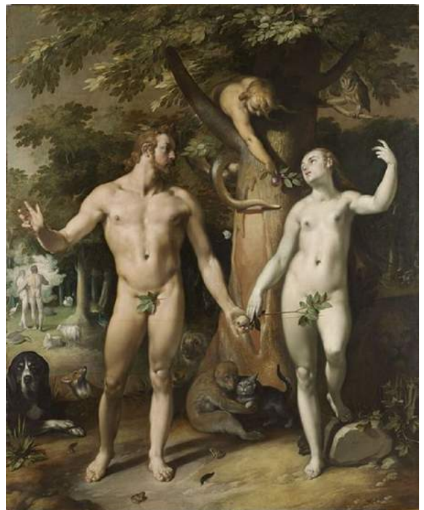
Cornelis van Haarlem, 'Zondeval', 1592

Volgens de christelijke interpretatie is het Satan de duivel, vermomd als een slang, die Eva verleidt te zondigen. Vroeg in de Middeleeuwen komen al verhalen voor waarin het niet de slang als duivel is maar Lilith die wraak neemt. In oude kunst heeft de slang vaak een vrouwenhoofd.