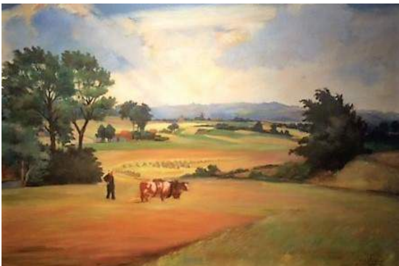
Jan Heesters, 'Zomerlandschap in België'

Zo nu en dan komen schilderijen, aquarellen, tekeningen en etsen terecht bij een veilinghuis of weten particulieren het Museum of de Stichting te vinden. Zo heeft de Stichting Vrienden sinds 2004 een kleine 50 werken, voornamelijk van de hand van Jan Heesters, in bezit gekregen. Naast aquarellen, tekeningen en etsen, in totaal een kleine dertig, omvat deze eigen verzameling inmiddels ruim twintig olieverfschilderijen. Een aanzienlijk deel hiervan is nu te zien op de tentoonstelling AANWINSTEN.