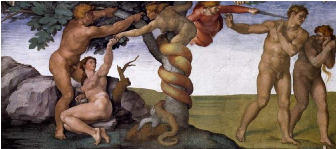
Michelangelo, 'De verdrijving uit het paradijs', 1475-1624 Sixtijnse Kapel