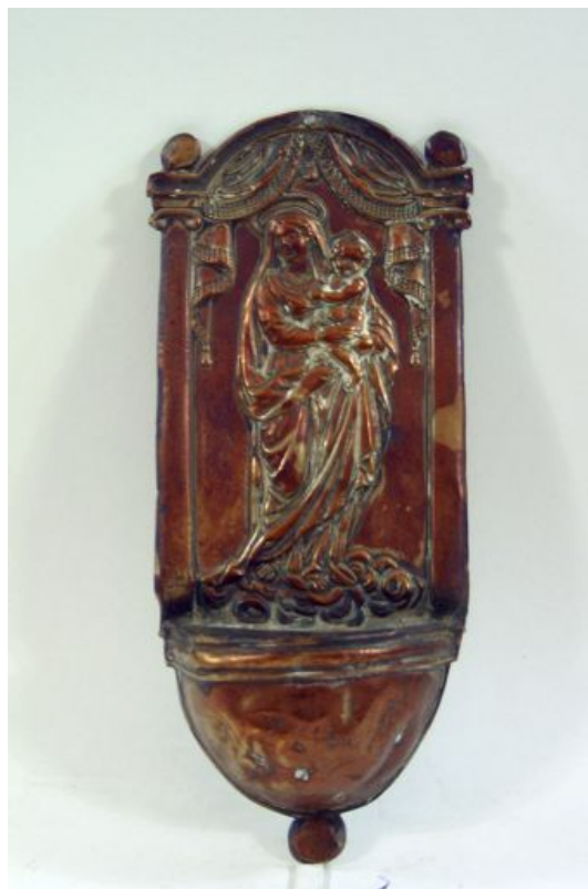
roodkoperen wijwaterbakje 20 x 15 cm

'bediend' waarbij hij of zij het laatste van de sacramenten ontving.