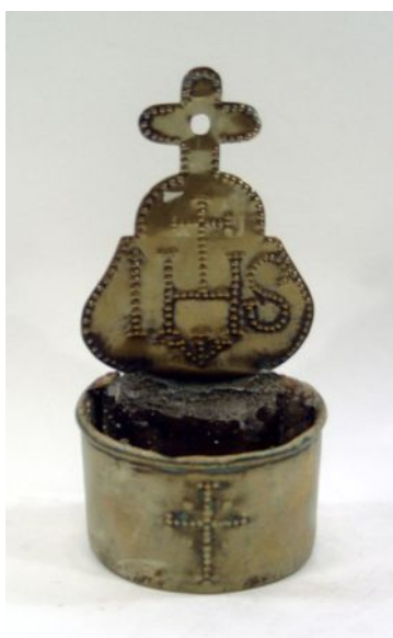
geelkoperen wijwatersbakje 15 x 10cm