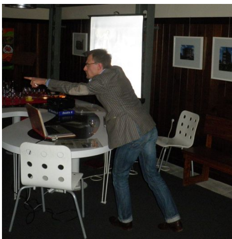
5 maart 2012 in een bomvol Architectenkerkje